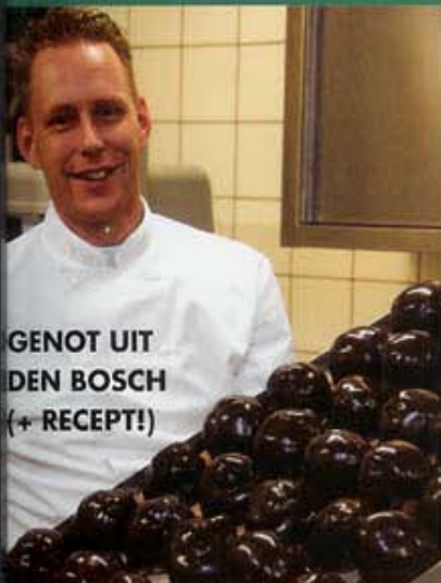
GENOT UIT DEN BOSCH (+ RECEPT!)