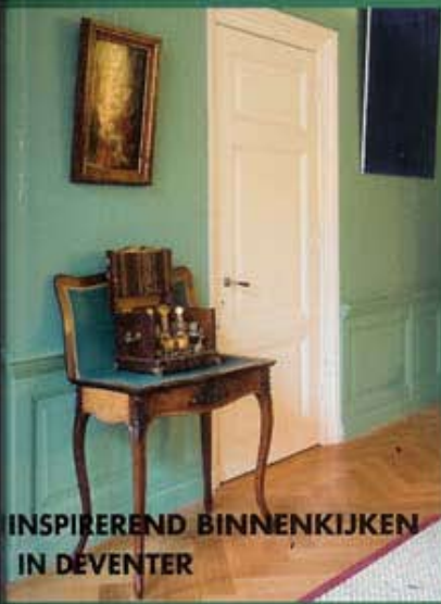
INSPIREREND BINNENKIJKEN IN DEVENTER