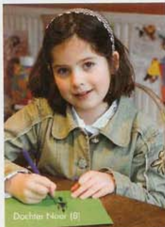
Dochter Floor (8)

Nadat het bestemmingsplan voor de bovenste (woon)verdieping