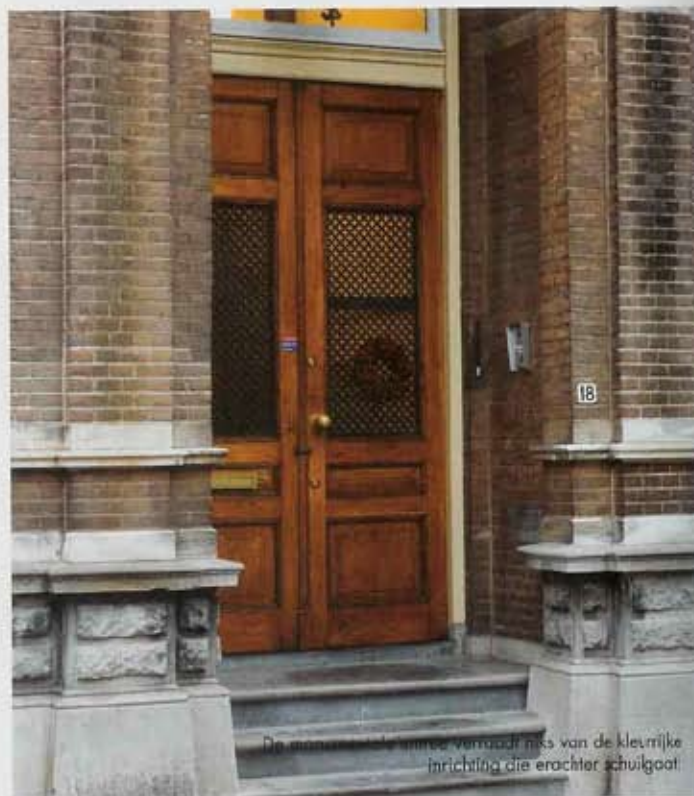
De monumentale winkel vermaakt riks van de kleurrijke inrichting die erachter schuilgaat

Binnenkort worden er twee banieren aan de gevel bevestigd, zodat het nog meer opvalt dat er tegenwoordig een wijnhandel in het monumentale pand is gevestigd. De wijnproeverijen zijn besloten, maar op donderdag en vrijdag kan iedereen tussen vier en acht binnenlopen om een bijzondere wijn voor het weekend uit te zoeken.