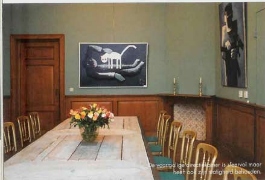
De voormalige directiekamer is sfeervol maar heeft ook zijn originaliteit behouden.